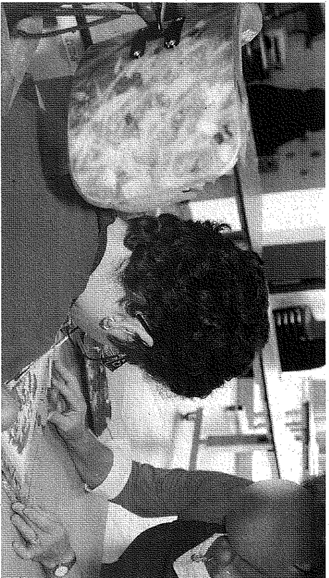
La Chrysalide qui dispose déjà de structures dédiées aux personnes atteintes de handicaps de tous types, est le porteur de ce projet destiné à des enfants et adolescents souffrant de troubles mentaux.

Handicap. Dès lundi un service d'accompagnement pour les jeunes présentant des déficiences ouvrira au centre-ville.